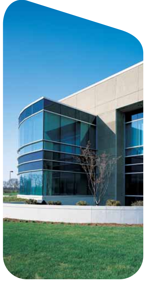
Pilkington Eclipse Advantage™ Arctic Blue

Pilkington Eclipse Advantage™ her ne kadar sert kaplamalı bir cam olsa da temperlendiğinde veya büküldüğünde özelliklerinde hiçbir değişiklik olmaz.