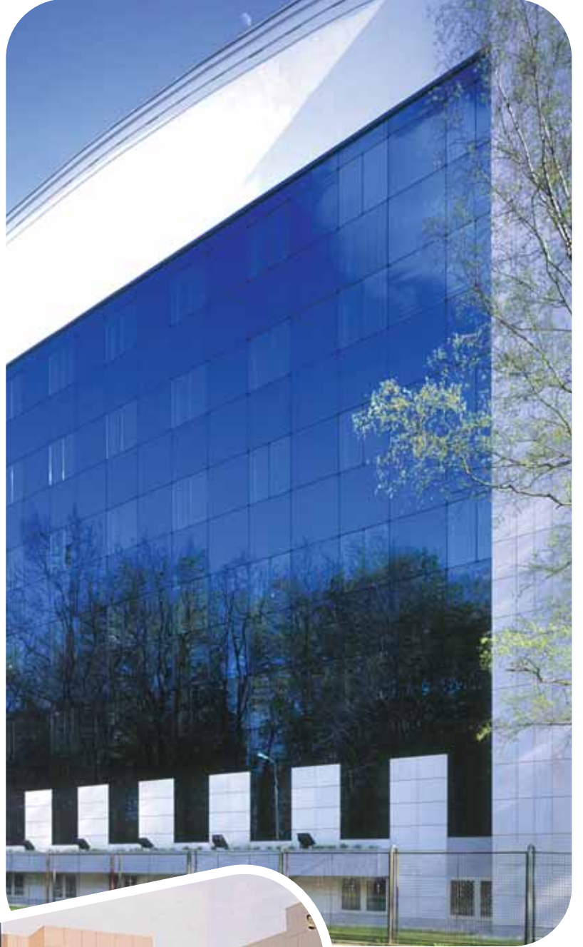
Pilkington Eclipse Advantage® Arctic Blue

• Fabrika stokundan hızlı bir şekilde gönderilir.