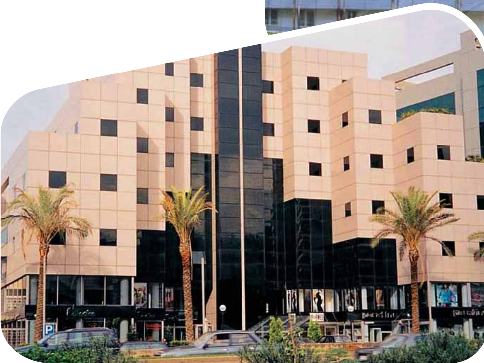
Pilkington Eclipse Advantage® Gri